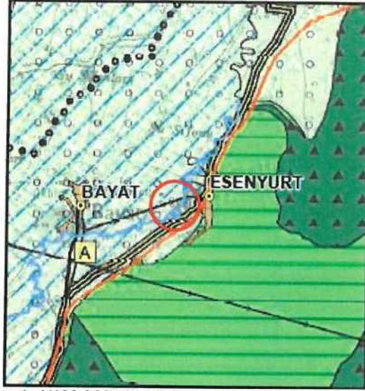
Plan 1: 1/100.000 ölçekli Çevre Düzeni Planı

kuruluşların görüşlerine uyularak ilgili idaresince yapılır ve onaylanır. Kullanımlardan ÇED Yönetmeliği kapsamında kalanlar için "Çevresel Etki Değerlendirmesi Olumlu" veya "Çevresel Etki Değerlendirmesi Gerekli Değildir" kararını bulunması, ÇED Yönetmeliği kapsamı dışında olanlar için ise ilgili kurum ve kuruluşların uygun görüşü olması kaydı ile hazırlanacak olan imar planları çevre düzeni planı değişikliğine gerek olmaksızın ilgili idaresince hazırlanır ve onaylanır. Onaylanan planlar sayısal ortamda veri tabanına işlenmek üzere Bakanlığa gönderilir. Söz konusu tesisler/tesis alanları amacı dışında kullanılamazlar." Denilmektedir.