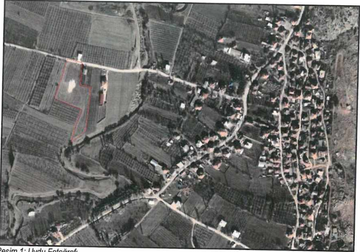
Resim 1: Uydu Fotoğrafı

Antalya, Büyükşehir, Korkuteli Belediyesi Esenyurt (Karadın) Mahallesi sınırları içerisinde , 165 ada 28 parsel üzerinde (8806.39 m 2 ) , N24C-17C numaralı paftaya giren 1/5000 ölçekli Nazım İmar Planı hazırlanmıştır.