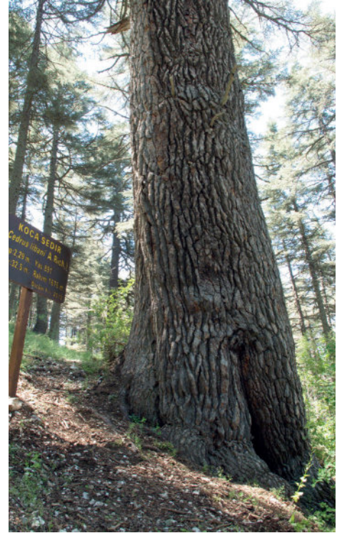
Koca Sedir.