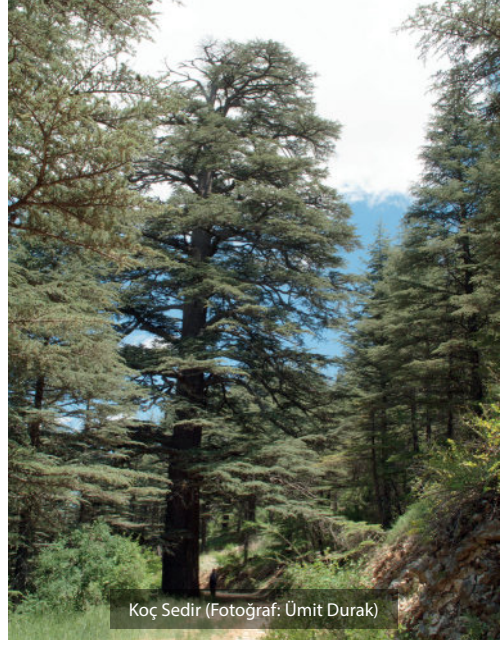
Koç Sedir

Tahmini yaşı 680, gövde çapı 2, uzunluğu ise 38 metredir. Anadolu Selçuklu Devleti son bulduktan sonra bir müddet Teke Beyliğine ve 1423 yılından sonra da Osmanlı İmparatorluğuna tanıklık etmiş bir ağaçtır. İslam ve birçok dini inanışa göre kutsal kabul edilmiştir. Mistik anıt ağaçtır (Tarım ve Orman Bakanlığı, 2020a).