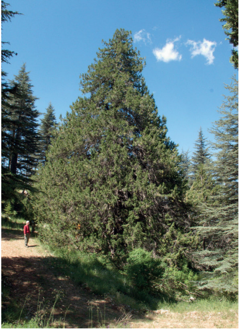
Şah Ardıç / Kokulu Ardıç