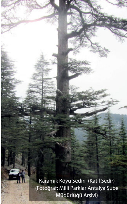
Karamık Köyü Sediri (Katil Sedir)