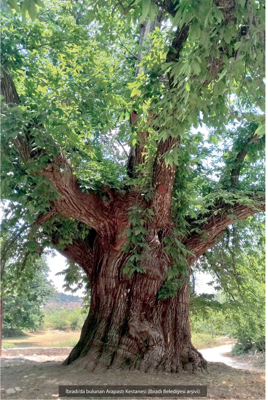
Ibradı'da bulunan Arapastı Kestanesi