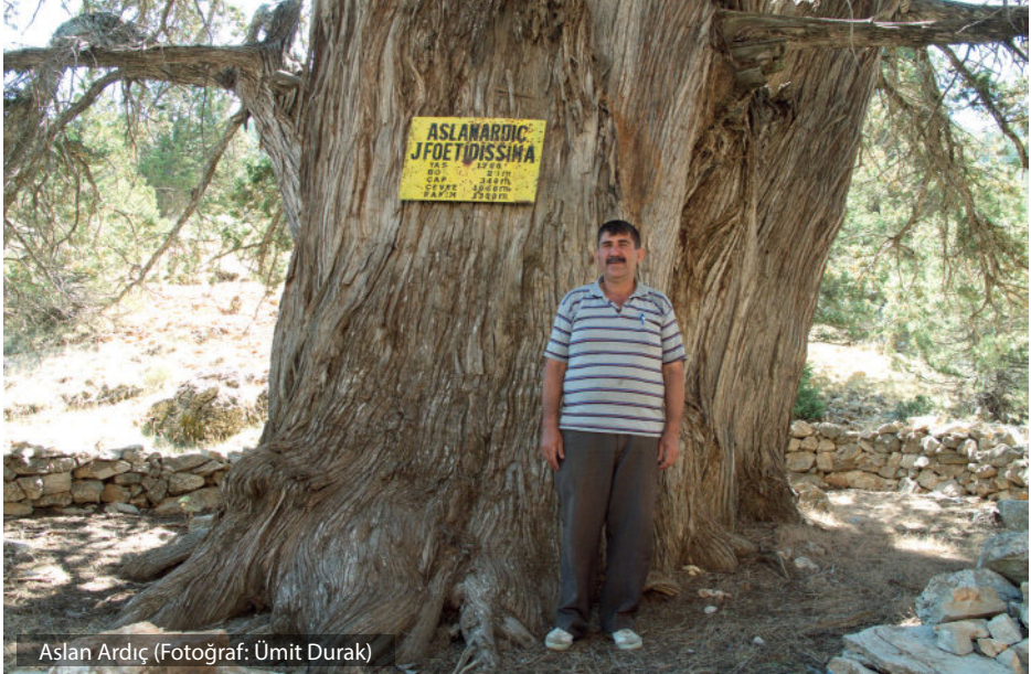
Aslan Ardıç

23,2 m boyunda, 3 m gövde çapında ve 9,52 m gövde çevresindeki Aslan Ardıç'ın yaşı yaklaşık 1700 olarak belirlenmiştir. M.S 395 yılına kadar Roma İmparatorluğu egemenliğine, 395-1080 yılları arasında Doğu Roma (Bizans) İmparatorluğu egemenliğine, 1080-1324 yılları arasında Doğu Roma İmparatorluğu egemenliğine, 1324-1423 yılları arasında da Anadolu Selçuklu Devleti egemenliğine tanıklık etmiş bir ağaçtır. Halk ozanı Abdal Musa'nın deyişlerinde yer almış bir ağaç olup, Alevilik kültüründe önemli bir yeri vardır. Mistik anıt ağaçlardandır (Tarım ve Orman Bakanlığı, 2020a).