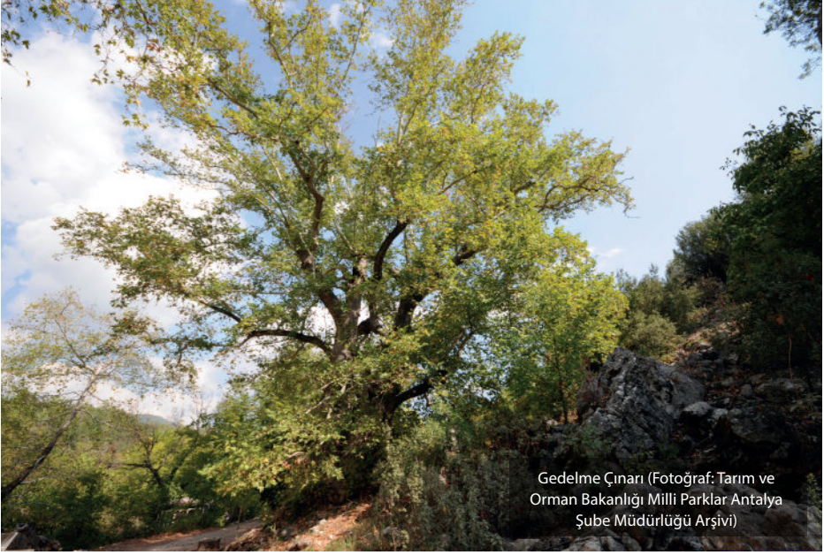
Gedelme Çınarı

Gövdesinin ıslak yapıya sahip olması nedeniyle şimşekleri üzerine çekmesi onun kendi kendine yandığı gibi bir inanca sebebiyet verir.