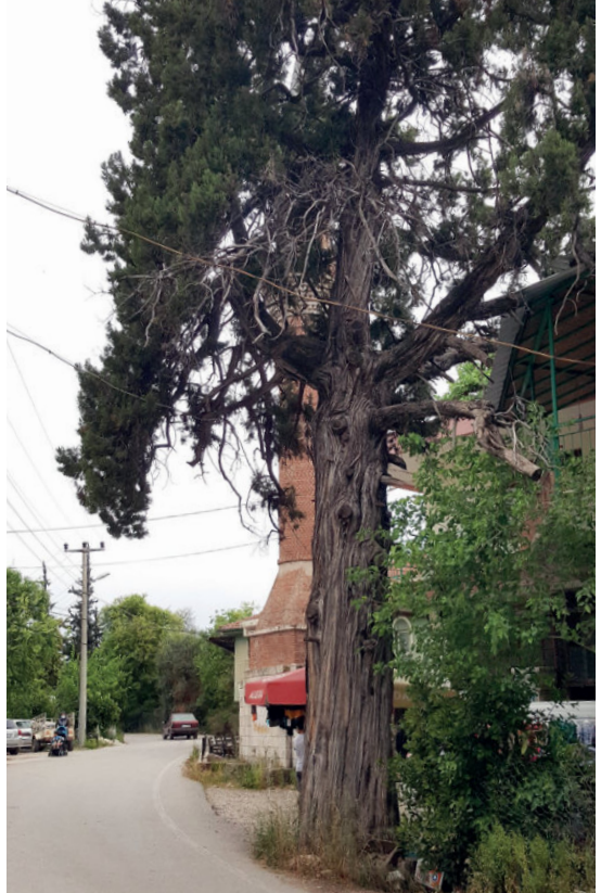
Konyaaltı/Gökçam Anıt Ardıç Ağacı

Ardıç ağacının en önemli özelliği, üremeye devam edebilmesi için ardıç kuşuna ihtiyacının olmasıdır. Çünkü Ardıç kuşları, ardıç ağaçlarından besinlerini alır ve sindirdikten sonra katı bir atık şeklinde dışarı atar. Bu şekilde toprağa düşen tohumlar filizlenerek çoğalırlar. Ardıç kuşu, ismini ardıç ağacından almıştır. Ardıç ağacı normalde yüksek rakımlarda yetişen bir ağaçtır. Konyaaltı’nda, deniz seviyesinde yetişmiş ve asırlar boyu da hayatta kalmış olması da bu ardıç ağacını diğer ardıç ağaçlarından farklı kılmaktadır.