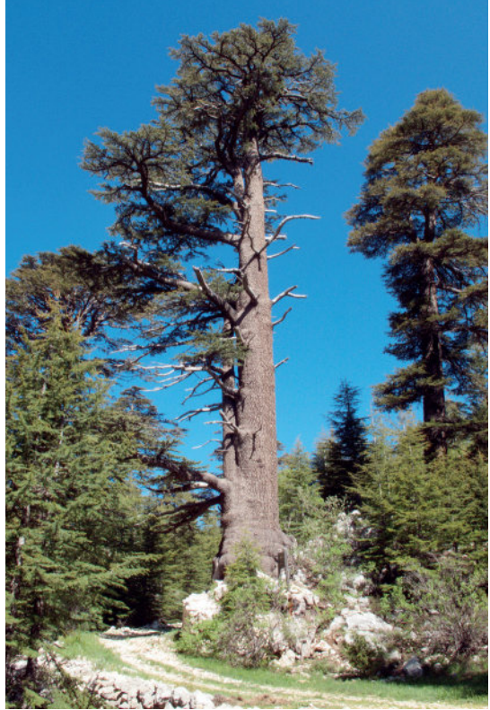
Koca Katran / Lübnan Sediri