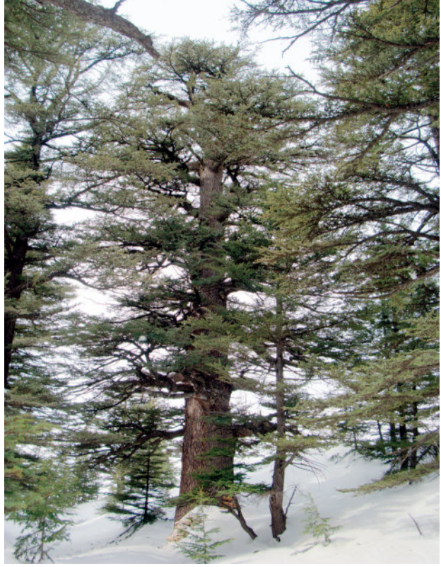
Ambar Katran / Dibek Sedir

ve yabancı turistler için deniz, kum ve güneş tatili için tercih edilen bir yöredir. Bu anlamda Kemer'in kırsalında yer alan anıt ağaç yakınında bulunan tarihi doku ile birlikte turistin ilgisini doğa ve kültüre çekme açısından oldukça önemlidir.