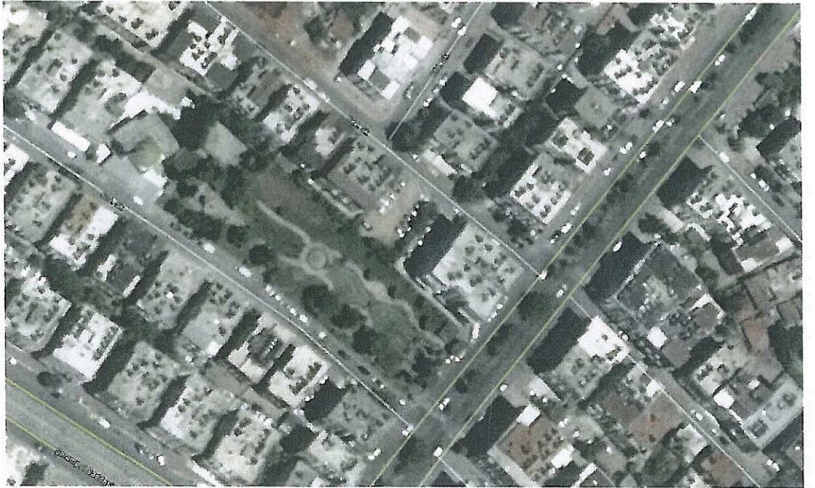
(Şekil 1. Hava Fotoğrafı)

Ancak geçen zaman içinde Antalya Su ve Atıksu İdaresi Genel Müdürlüğü İdaresi (ASAT), hattın bu kısmında deplase yaparak 622 yoldan sonraki kanalı çevirerek Tonguç Caddesindeki ana kanala bağlamıştır. Bu nedenle söz konusu parseldeki mevcut ve işlevsiz olan eski yağmur suyu kanalının inşaat aşamasında iptal edilmesinde herhangi bir sakınca olmadığı ASAT tarafından yazıyla bildirilmiştir. ( ASAT 'ın 9.7.2014 gün 15125 sayılı yazısı)