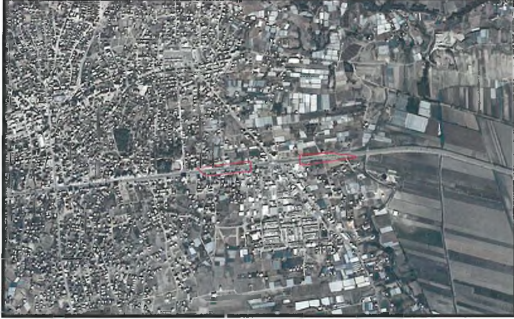
Şekil 1. Hava Fotoğrafi

Antalya İli Serik İlçesi sınırları içerisinde 026A-08C ve 026A-08D nolu 1/5000 ölçekli nazım imar planı paftalarında yer almaktadır.