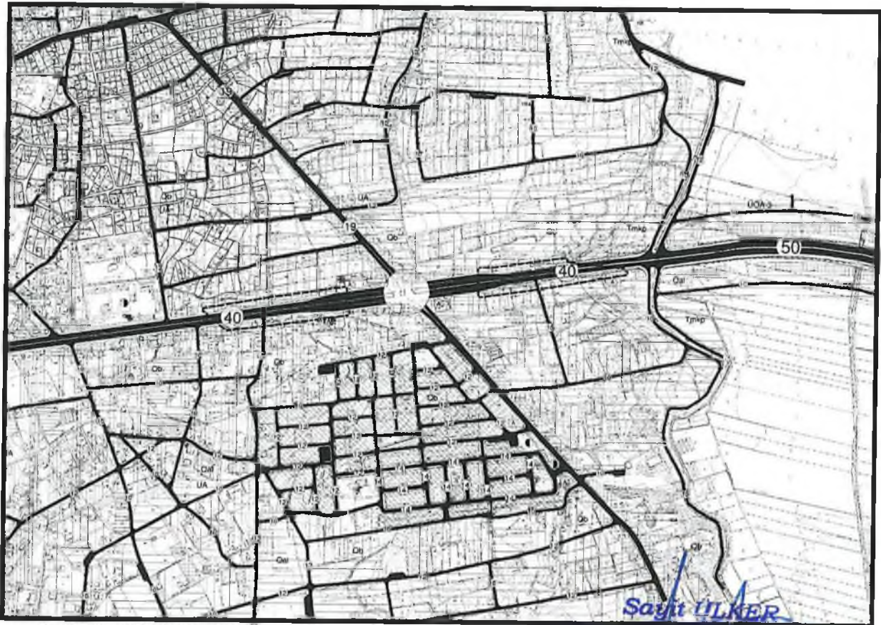
Şekil 5.1/5000 ölçekli Öneri Nazım İmar Planı