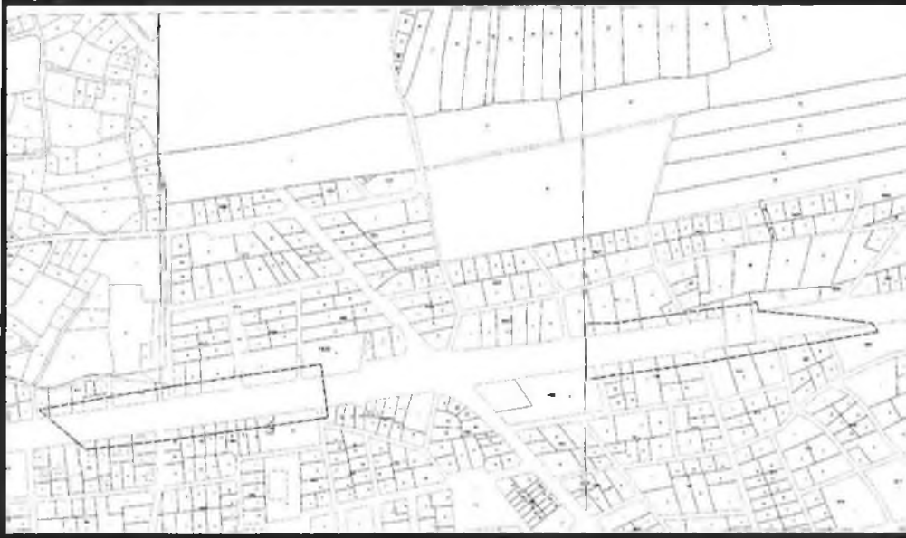
Şekil 2. Kadastral Durum

Serik Karadayı kavşağı Serik İlçesi Antalya-Alanya yolu Serik Merkezde Boğazkent Mahallesi sapağında yer almaktadır.