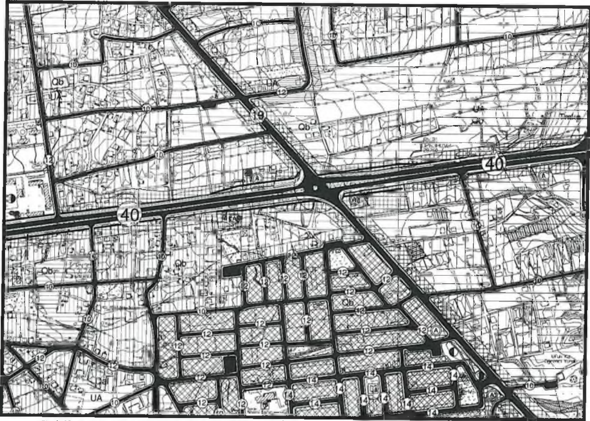
Şekil 4.1/5000 ölçekli Mevcut Nazım İmar Planı

Hazırlanan 1/5000 ölçekli nazım imar planı değişikliği önerisi ekte sunulmaktadır.