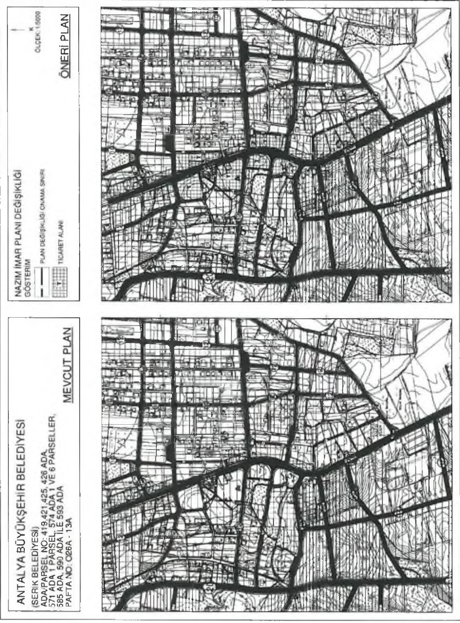
Şekil 3. Öneri Plan

Hazırlanan 1/5000 ölçekli nazım imar planı deęişiklięi önerisi ekte sunulmaktadır.