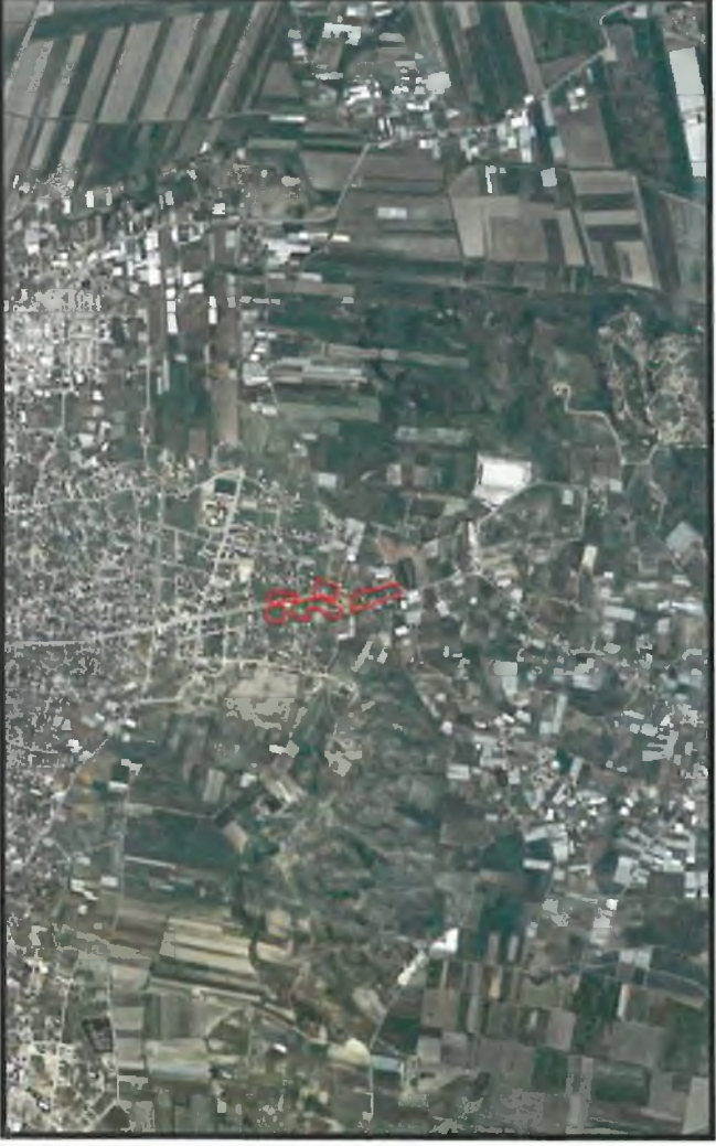
Şekil 1. Hava Fotoğrafi

Antalya İli Serik ilçesi sınırları içerisinde O26A-13A nolu 1/5000 ölçekli nazım imar planı paftalarında yer almaktadır.