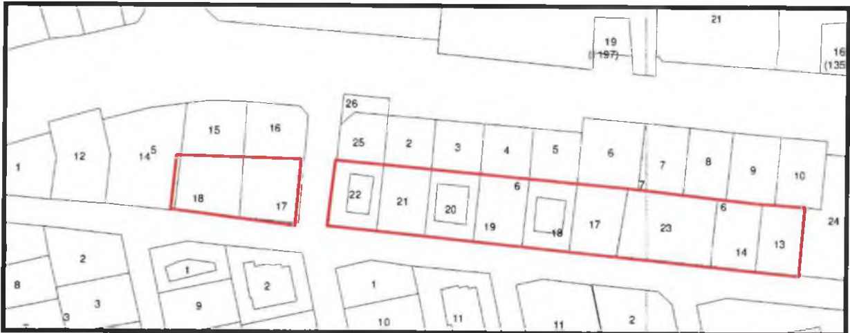
Şekil 2. Kadastral Durum

5 ada 17 ve 18 parseller ile 6 ada 13, 14, 17, 18, 19, 20, 21, 22 ve 23 parseller Serik İlçesi Gedik Mahallesi sınırları içerisinde yer almaktadır.