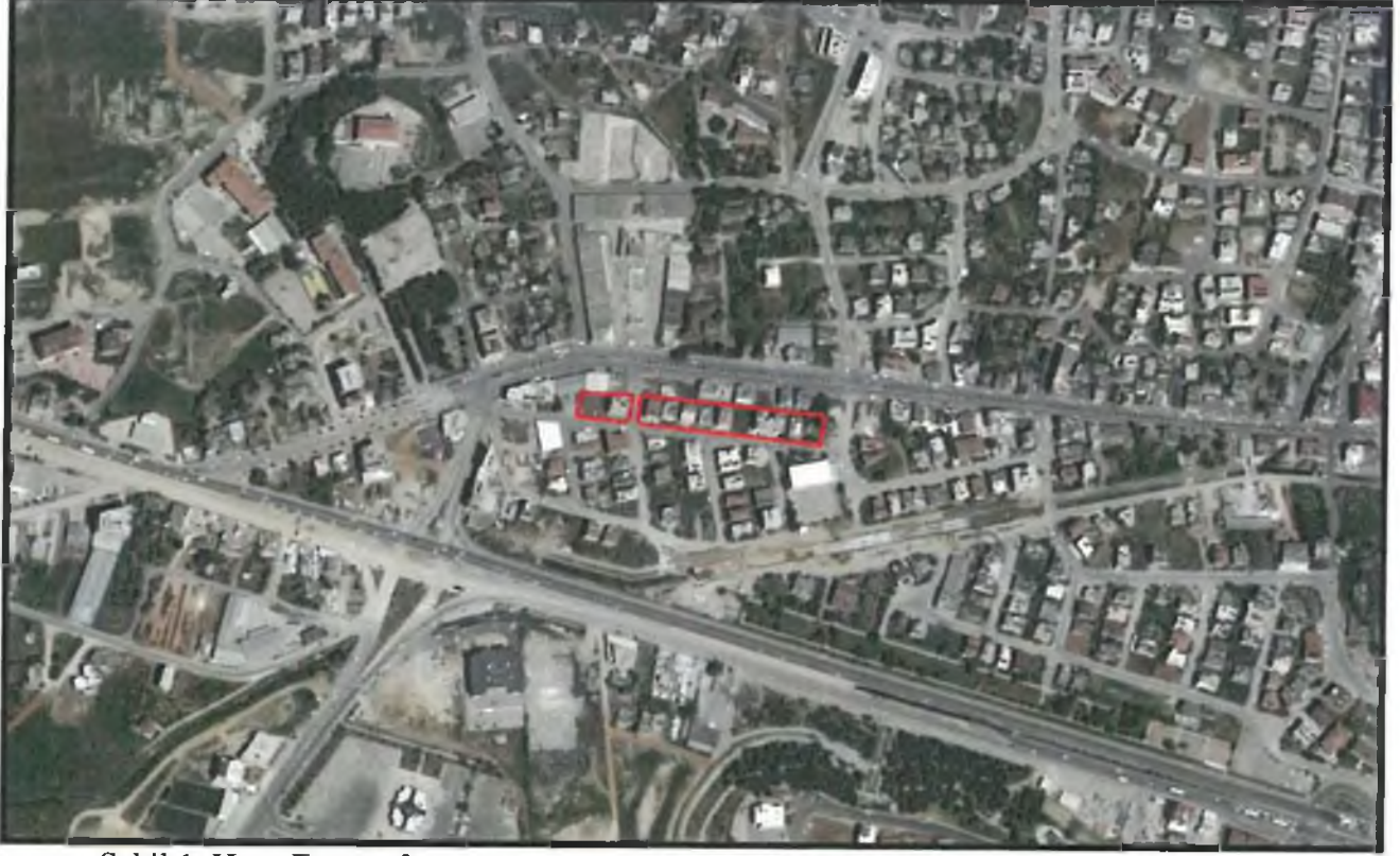
Şekil 1. Hava Fotoğrafı

Antalya İli Serik ilçesi sınırları içerisinde O26A-07C nolu 1/5000 ölçekli nazım imar planı paftasında yer almaktadır.