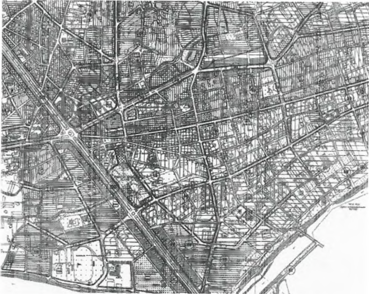
Askıda yer alan 1/5000 ölçekli nazım imar planı değişikliği

Söz konusu bu plan değişikliği aşağıda gösterilmiştir.