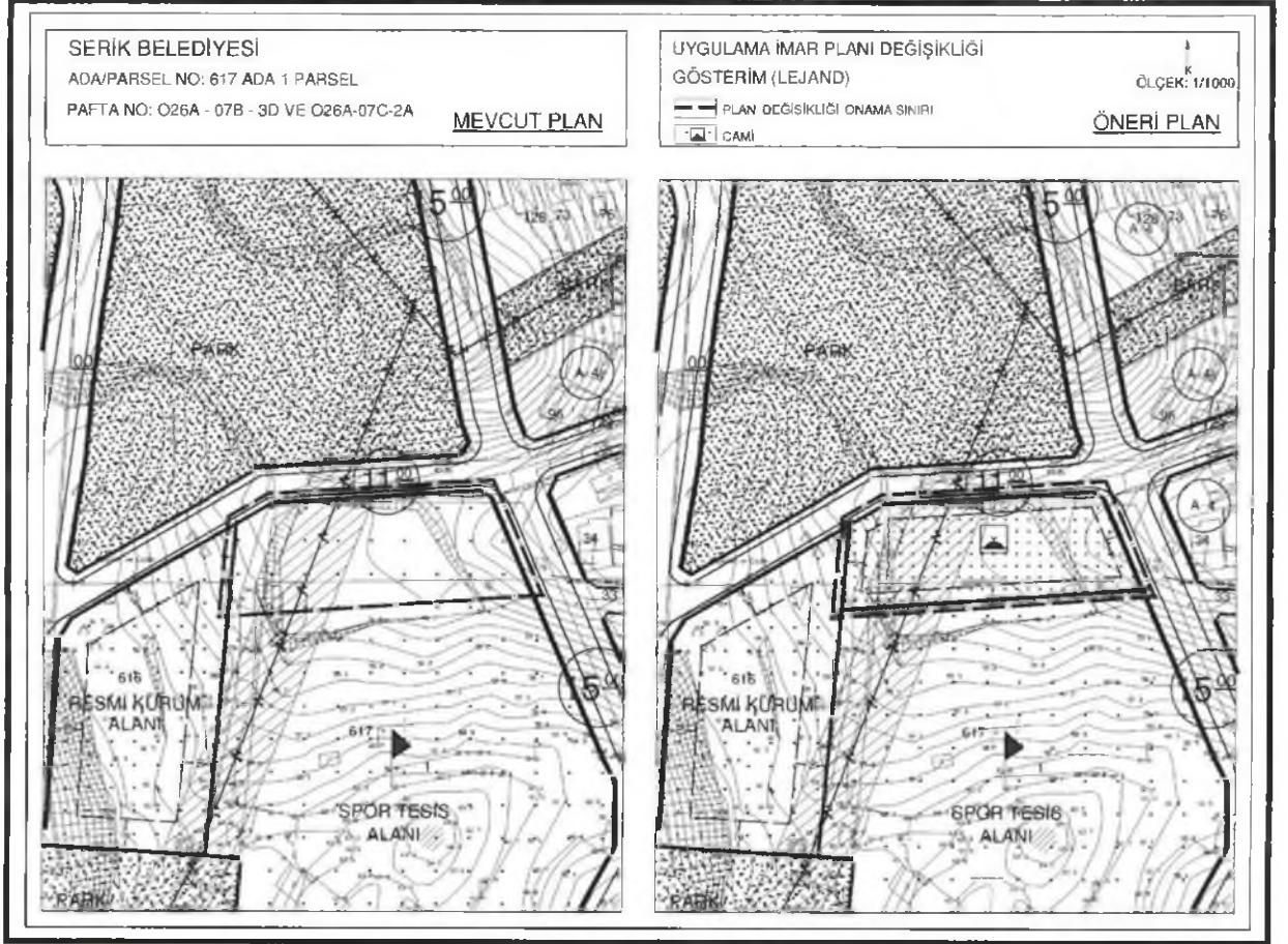
Őekil 3.Plan Orneę

Hazırlanan 1/1000 lekli Uygulama İmar Planı deęişiklięi nerisi ekte sunulmaktadır.