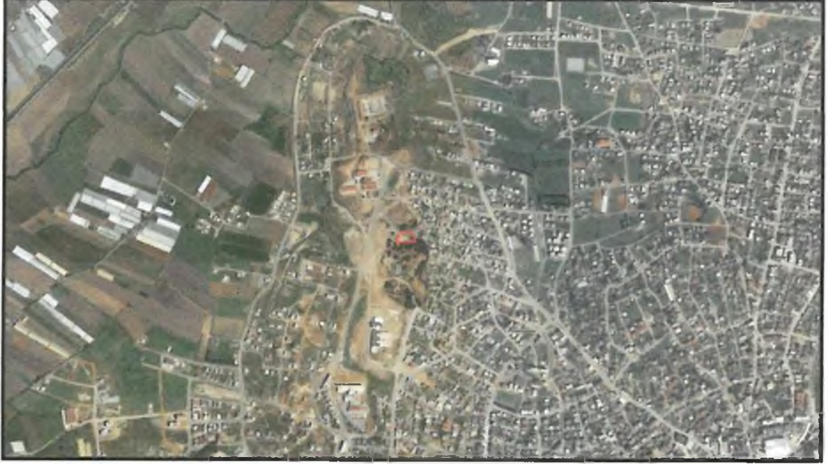
Şekil 1. Hava Fotoğrafi

Antalya İli Serik ilçesi sınırları içerisinde O26A-07B-3D ve O26A-07C-2A nolu 1/1000 ölçekli Uygulama İmar Planı paftalarında yer almaktadır.