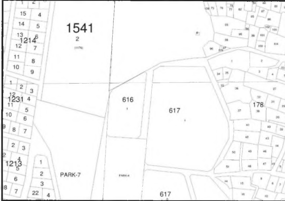
Şekil 2. Kadastral Durum

617 ada 1 parsel, Serik İlçesi Merkez Mahallesi sınırları içerisinde yer almaktadır.