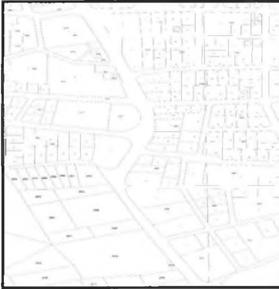
Şekil 2. Kadastral Durum

Plan değişikliği yapılacak olan Tuzla Burun caddesine cephesi bulunan parseller, Serik İlçesi Yeni Mahalle sınırları içerisinde yer almaktadır.