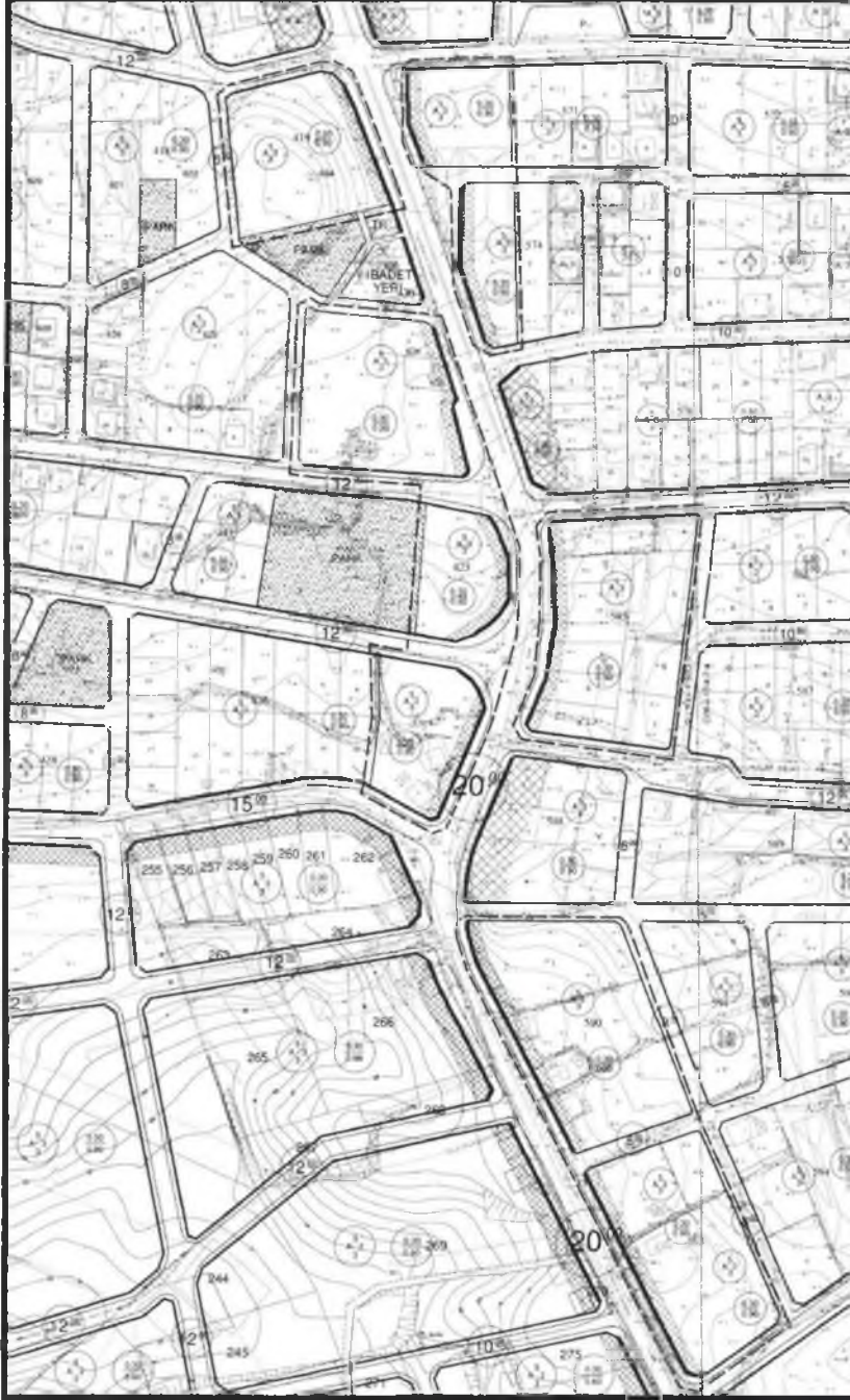
Şekil 3. Öneri P1

Hazırlanan 1/1000 ölçekli uygulama imar planı deęiřiklięi önerisi ekte sunulmaktadır.