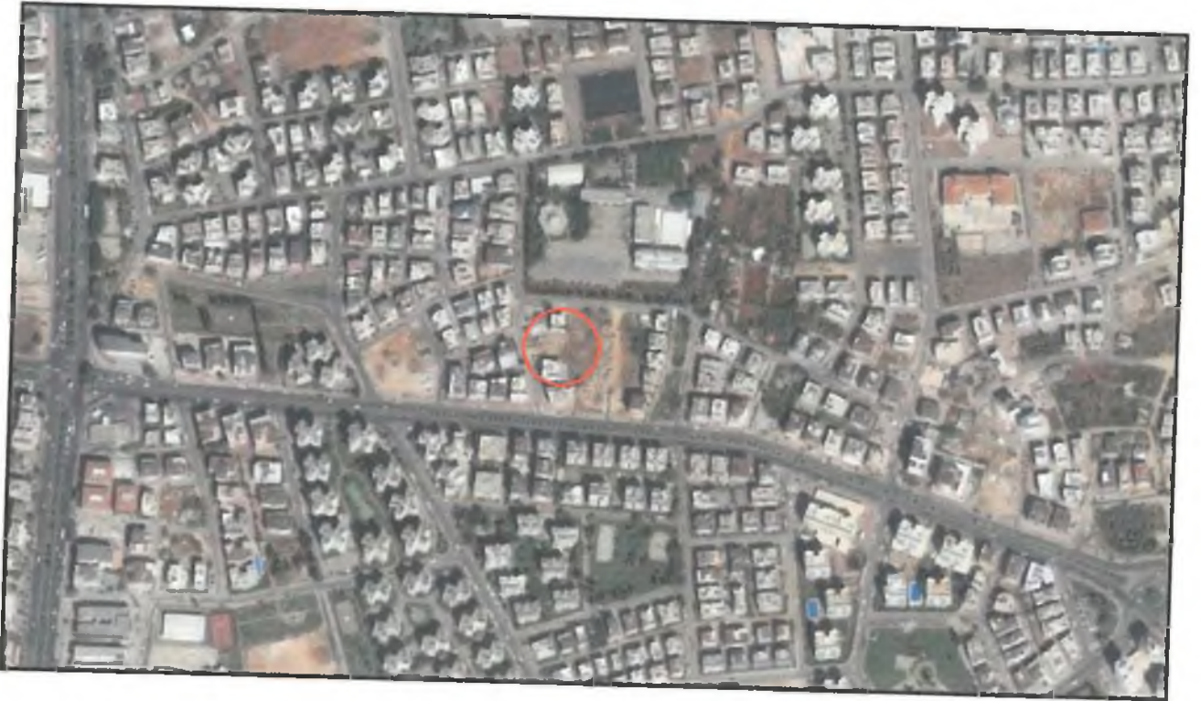
Resim 1: Uydu Fotoğrafi

Antalya ili , Büyükşehir , Muratpaşa Belediyesi, Kızıllarik Mahallesi sınırları içinde 5908 ada, 10 numaralı parselli kapsayan 829 m2 büyüklüğündeki taşınmaz üzerinde , 1/5000 ölçekli 20L numaralı paftaya giren 1/5000 ölçekli Nazım İmar Planı Değişikliği hazırlanmıştır.