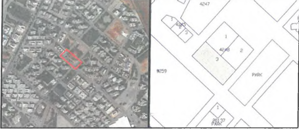
Şekil 1. Hava Fotoğrafı

Planlama alanı; Antalya İli, Konyaaltı Belediyesi, Siteler Mahallesi sınırları içindeki 4248 ada 3 nolu parsel numarasına kayıtlı 1/5000 ölçekli O25A-13B nolu Nazım İmar Planı paftasına giren 1537 m 2 büyüklüğündeki alanı kapsamaktadır.