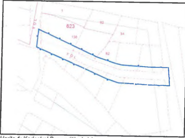
Harita 1: Kadastral Durum (ölçeksiz)