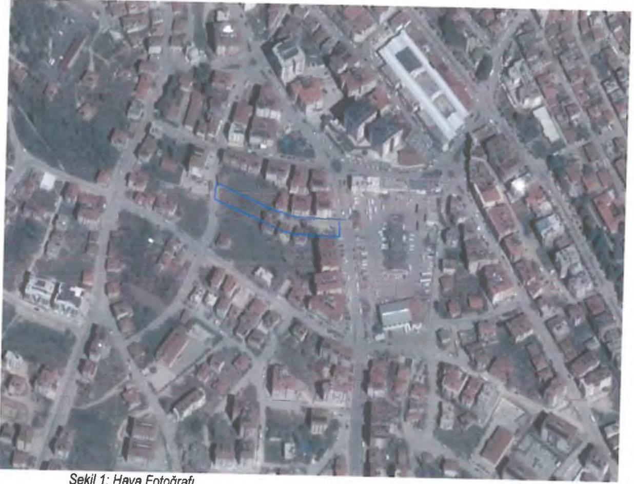
Şekil 1: Hava Fotoğrafı

Antalya ili , Büyükşehir, Elmalı Belediyesi , Yenimahalle Mahallesi sınırları içinde , O23-c-04-a-2-d ve O23-c-04-a-3-a numaralı 1/1000 ölçekli İmar planı paftalarına giren , 76 adada bulunan 10 m'lik yolu kapsayan 1/1000 ölçekli Uygulama İmar Planı Değişikliği hazırlanmıştır.