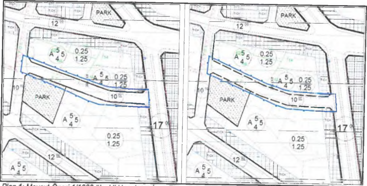
Plan 1: Mevcut-Oneri 1/1000 ölçekli Uygulama İmar Planı değişikliği (ölçeksiz)

Elmalı Belediyesi , Yenimahalle Mahallesi , 76 adada bulunan ve 7 m olarak terki yapılan 10 m'lik yolun her iki tarafından eşit olarak terk işlemi yapılabilmesine olanak sağlayan 1/1000 ölçekli Uygulama İmar Planı değişikliği hazırlanmıştır.