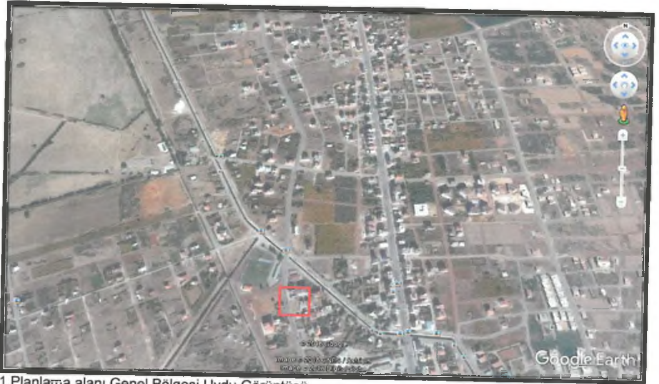
1. Planlama alanı Genel Bölgesi Uydu Görüntüsü