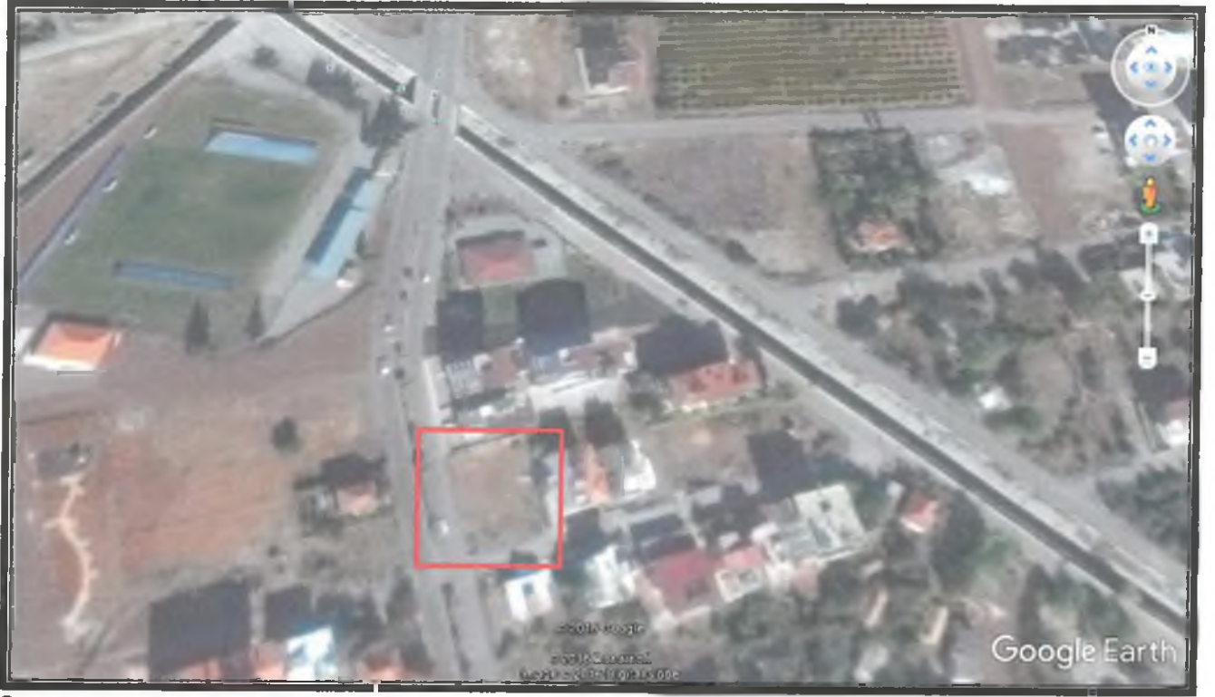
2. Planlama alanı Uydu Görüntüsü

50 ada 10 ve 11 nolu parsellerin yürürlükteki 1/1000 ölçekli Uygulama İmar Planında kullanım fonksiyonu; Konut altı ticaret olup yapılaşma koşulu 10 nolu parsel için; TİA=505 m 2 h=5 kat, 11 nolu parsel için; TİA=432 m 2 h=5 kat olarak görülmektedir.