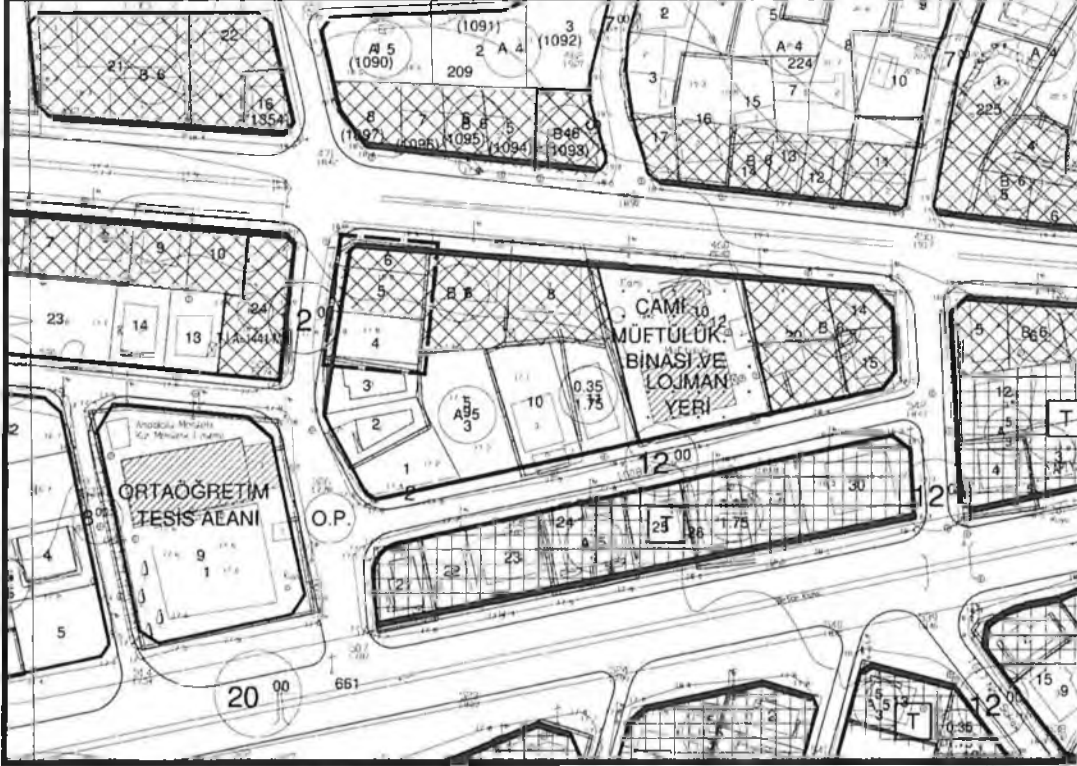
Şekil 3. Planlama alanının mevcut 1/1000 ölçekli Uygulama İmar Planı Plan Örneęi

Planlama alanı içerisinde bulunan 10 ada 4 parsel mevcut imar planında konut alanı olarak planlıdır. Plan deęişiklięi ile mevcut büyüklüęü 312 m 2 olan 10 ada 4 parsel konut alanından ticaret alanına dönüştürülmüştür. Bu alan için amaç mevcut 1/1000 ölçekli uygulama imar planında ticaret alanı olarak planlı 10 ada 5 ve 6 parseller ile konut alanı olarak planlı 10 ada 4 parselin tevhit edilebilmesi için 1/5000 ölçekli nazım imar planında 10 ada 4 parselin ticaret alanına dönüştürülmesini sağlamaktır.