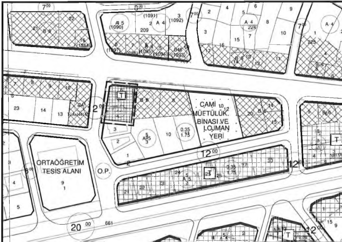
Şekil 4. Planlama alanının öneri 1/1000 ölçekli Uygulama İmar Planı Deęişiklięi Taslaęı