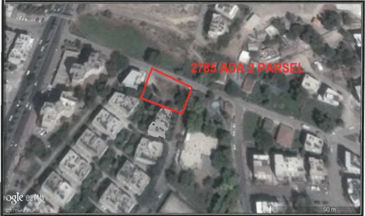
Şekil 1. Hava Fotoğrafı

Plan değişikliğine konu alan; Antalya ili, Muratpaşa İlçesi, Gebizli Mahallesi sınırları dahilinde 19-L nolu 1/5000 Ölçekli Nazım İmar Planı paftasında kalmaktadır.