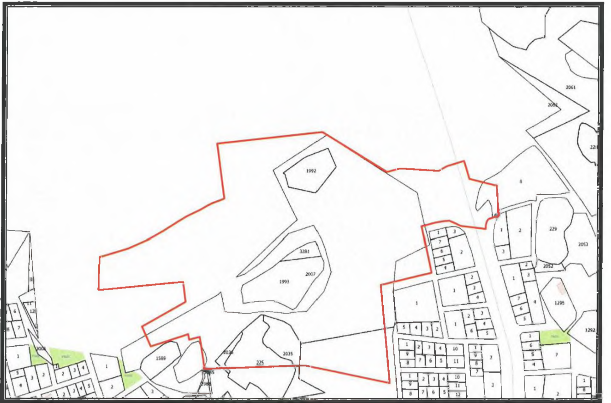
Şekil 2. Kadastral Durum.

Kepez İlçesi, Varsak Tapulaması, 1992, 3281, 1993, 2007, 2036, 225, 2035, 2610 parseller ve çevresine ilişkin kadastral durum aşağıdaki haritada verilmiştir. (Şekil 2)