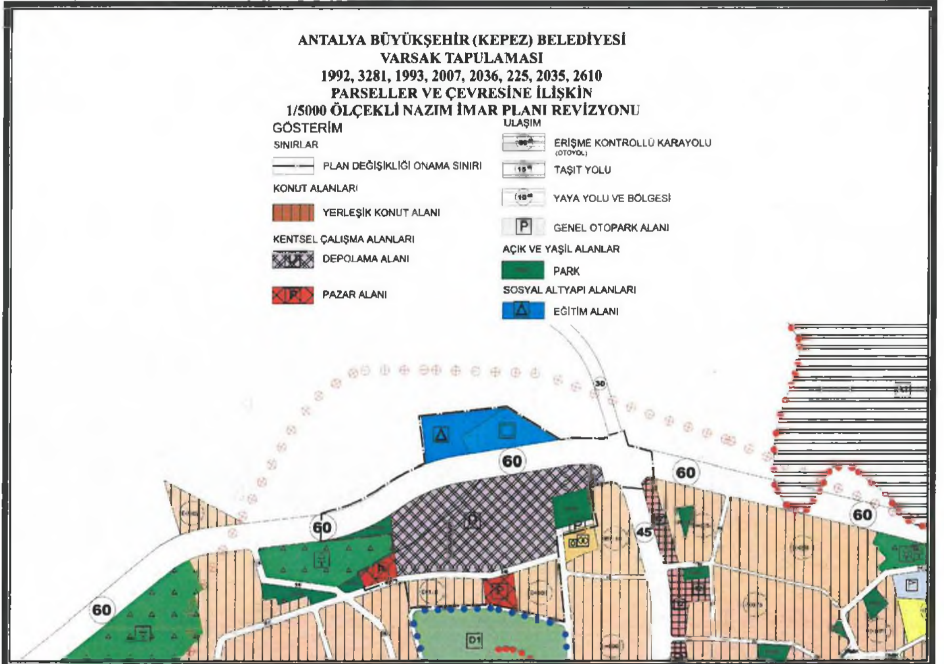
Şekil 4. Öneri 1/5000 ölçekli Nazım İmar Planı Revizyonu.

Ali Can TETİK Antalya Büyükşehir Belediyesi Şehir Plancısı